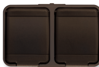
sepiabraun, ähnlich RAL 8014