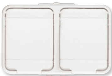
reinweiß, ähnlich RAL 9010