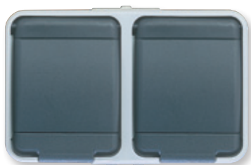
licht-/basaltgrau, ähnlich RAL 7035/7012