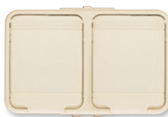
perlweiß, ähnlich RAL 1013