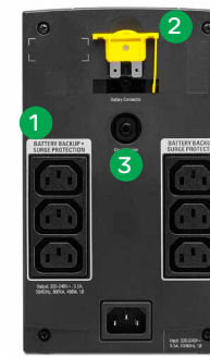
SX3800CI / SX31100CI