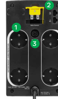
SX3800CI-GR / SX31100CI-GR