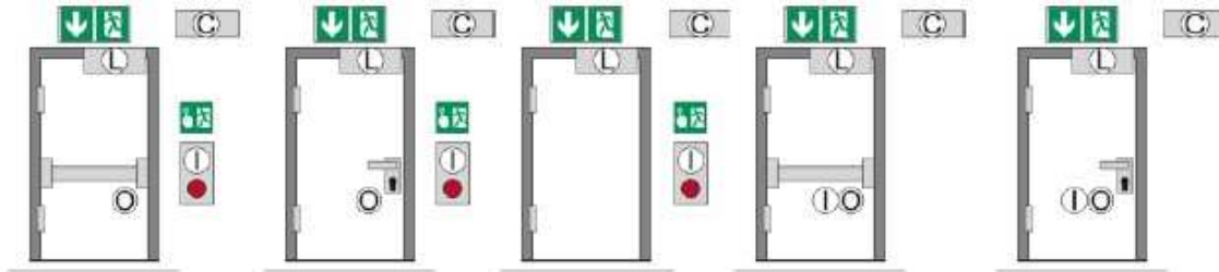
Esquema 2. Exemple de configuracions de portes amb sistema de sortida controlat elèctricament: pulsador i barra, pulsador i maneta, pulsador amb obertura directa, sistema combinat amb barra i sistema combinat amb maneta. Font: UNE-EN 13637. http://aenormas.aenor.com/es/normas

L'annex A de la norma relaciona la documentació necessària a entregar amb la instal·lació i les revisions de manteniment dels equips, que hauran de ser com a mínim anuals. També recomana verificacions periòdiques in situ, i facilita una exemple d'informe. Aquest annex, però, és informatiu, no normatiu.