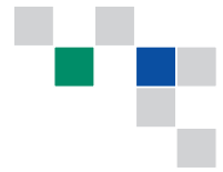
ABB già oggi soddisfa i requisiti di riduzione delle armoniche di domani