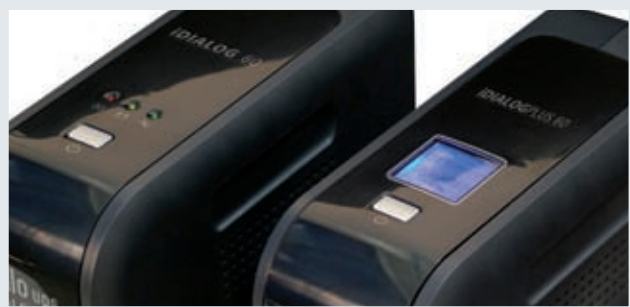
Particolare dei display