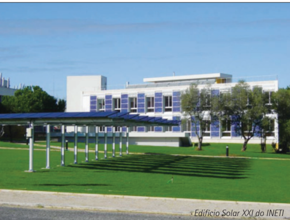
Edifício Solar XXI do INETI

{INTEGRAÇÃO DE SISTEMAS DE ENERGIAS RENOVÁVEIS NA CIDADE}