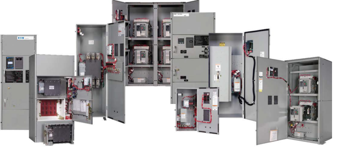
Eaton' un otomatik transfer şalterleri

Eaton günümüzün kritik güç piyasasında mevcut olan en geniş yelpazedeki otomatik transfer şalter serisini sunmaktadır ve elektrik sistemleri konusunda uzman seviyesinde bilgiye sahip dünya standartlarında servis ekibinin desteğine sahiptir. Uzmanlığımız müşterilerimize, hangi uygulama, bütçe ve özelleştirme gereksinimi için olursa olsun, güvenilir elektrik ihtiyaçlarını karşılamak üzere özel olarak tasarlanmış bir otomatik transfer şalteri çözümünü uygulamaya koymasına yardımcı olur.